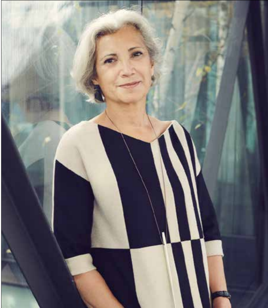
Carme Pinós (Estudio Carme Pinós)

“Hemos construido las nuevas villas como si se trataran de nuevos aterrazamientos contruidos con muros de piedra seca, semienterrándolas pero abriéndolas hacia el paisaje...”