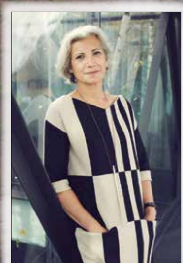
Carme Pinós (Estudio Carme Pinós)

Estudio Carme Pinós es el que ha llevado a cabo la reforma y ampliación del hotel Son Brull, en Pollensa (Mallorca). Se trata de un hotel rural de cinco estrellas que ocupaba un antiguo monasterio del siglo XVIII donde los promotores deseaban rehabilitar y ampliar el spa situado en el edificio principal, así como la construcción de cuatro nuevas villas en el territorio adyacente.