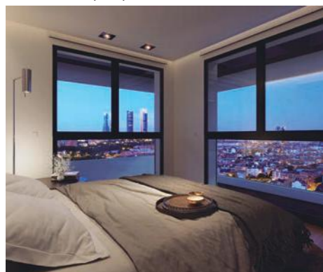
Foto: Dormitorio principal

Cabe destacar otra característica que las hacen singulares, el concepto y el diseño de las zonas comunes. De esta manera, frente a la tradicional urbanización habitual en los últimos años, Skyline se asemeja más a un hotel. Entre los distintos servicios que ofrecerá el complejo destacan, dentro de las zonas comunes, las dos piscinas. Una de ellas estará en la azotea, vigésimo quinta planta. Asimismo contará con huerto urbano, conserjería con servicios similares a un hotel, gimnasio, spa, jardines, zona de coworking, cocina completamente equipada, sistema de suelo radiante, así como garaje y trastero. Además, se instalarán los mejores acabados y equipamientos, tanto en sus zonas comunes como dentro de las viviendas.