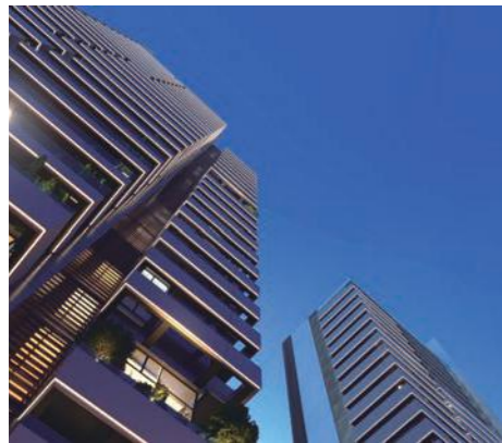
Foto: Vista de las dos Torres residenciales