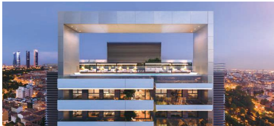
Foto: Vista superior Torre y Piscina

Debido a esta ubicación supondrá un impulso muy importante para el barrio de Tetuán, ya que implicará un cambio estructural y socioeconómico para la zona.