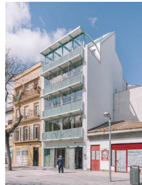
Centro de atención a la infancia. Rehabilitación de una edificación. (2016-2018)

Muchos temas relevantes en relación al papel de las mujeres en la arquitectura, a las actividades reproductivas, a los trabajos de cuidados, a la perspectiva de género en arquitectura y urbanismo, temas todos