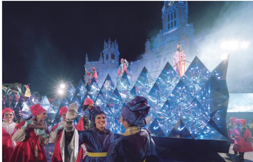
Foto: Carruajes de los Reyes Magos. Madrid. 2016.2017.2018

ellos muy interesantes de abordar no sólo para la profesión sino para la sociedad en su conjunto, son mirados con desdén y desprecio en muchos ámbitos de la arquitectura. Justo ayer leía en el primer volumen de cuatro números que conmemora el centenario de la revista de Arquitectura, el Nº. 378, que recoge varios artículos (1919, 1922 y 1944) sobre la presencia de las mujeres en el mundo de la arquitectura y parece que el carácter accesorio y secundario de la mujer en este mundo del que se habla en los tres extractos, para algunos, sigue vigente. Yo no hago más que tratar con estudiantes brillantes y maravillosas mujeres que destacan por su trabajo y profesionalidad, con lo que espero que sea sólo cuestión de tiempo que tengan la relevancia que merecen.