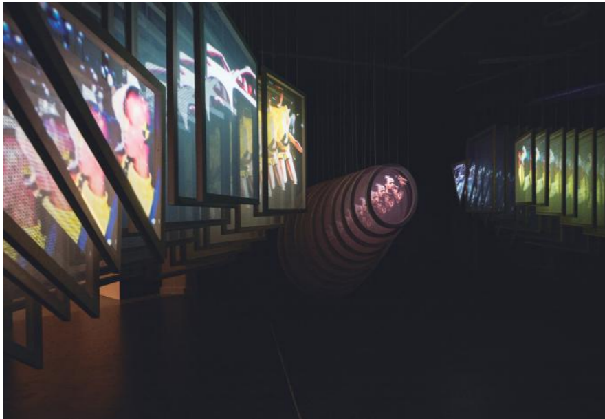
Foto: Los Fantasmas de Susie Sierra. Exposición "Las Voces del GPS" en CentroCentro. Madrid. 2018-Imagen Subliminal

Para nosotros recibir el reconocimiento de tus compañeros de profesión o de una feria de arte es una de las cosas más emocionantes que puede ocurrirte porque te da la oportunidad de agradecer públicamente a tu familia y a las personas con las que trabajas día a día su implicación y ganas. Tener un momento para parar, pensar y celebrar siempre es de agradecer. Y luego nos permite hacer alusión a estos reconocimientos como muestra de confianza en nuestro trabajo a nuevas personas que no nos conocen todavía.