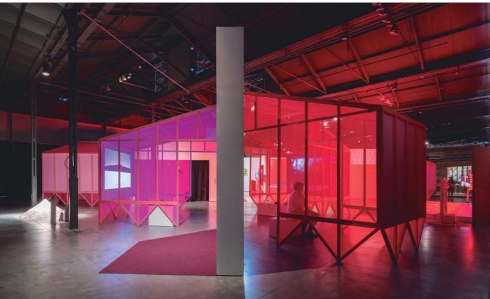
Ecovisionarios - Arte para un planeta en emergencia. Exposición en Matadero Madrid. Madrid. 2019

ser sus futuros habitantes, sus promotores, el contexto temporal en el que se inscribe, además de los llamados autores o autoras, que indudablemente ya tienen una manera de hacer que, de algún modo, se verían reflejadas en el resultado del proceso.