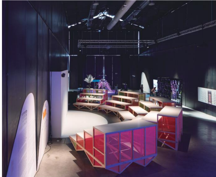
Foto: Jardín Cyborg IMNA. Comisariado y diseño de la exposición en Matadero Madrid. Madrid. 2019

Con tu estudio Elii, participasteis en el 2016 en las XV Bienal de Venecia, en el Pabellón de España: ¿qué ha significado para tu proyección internacional?