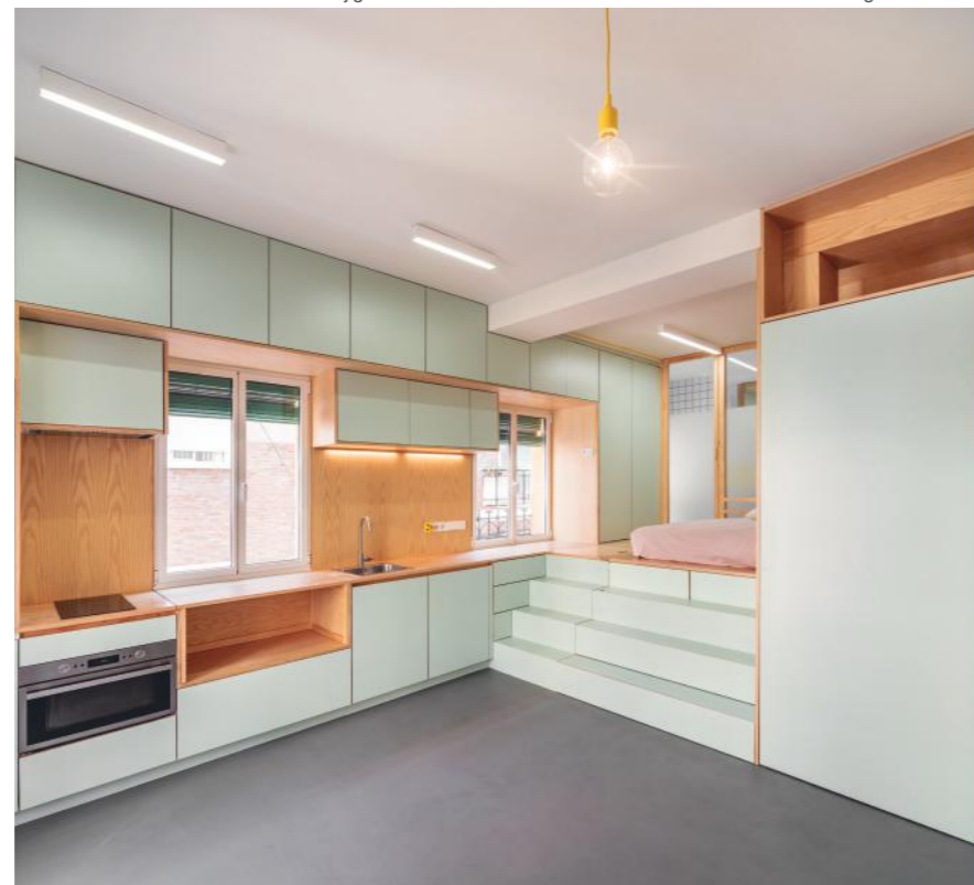
Foto: Yojigen Poketto. Rehabilitación de una vivienda. Madrid. 2017-Imagen Subliminal

En la actualidad desarrollamos diversos trabajos en múltiples fases. Acabamos de terminar unas obras de reforma de algunos de los espacios de un teatro en Madrid; tenemos varios proyectos residenciales