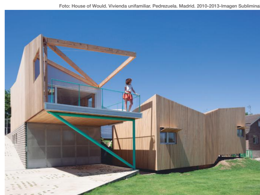
Vivienda unifamiliar. Pedrezuela. Madrid. 2010-2013