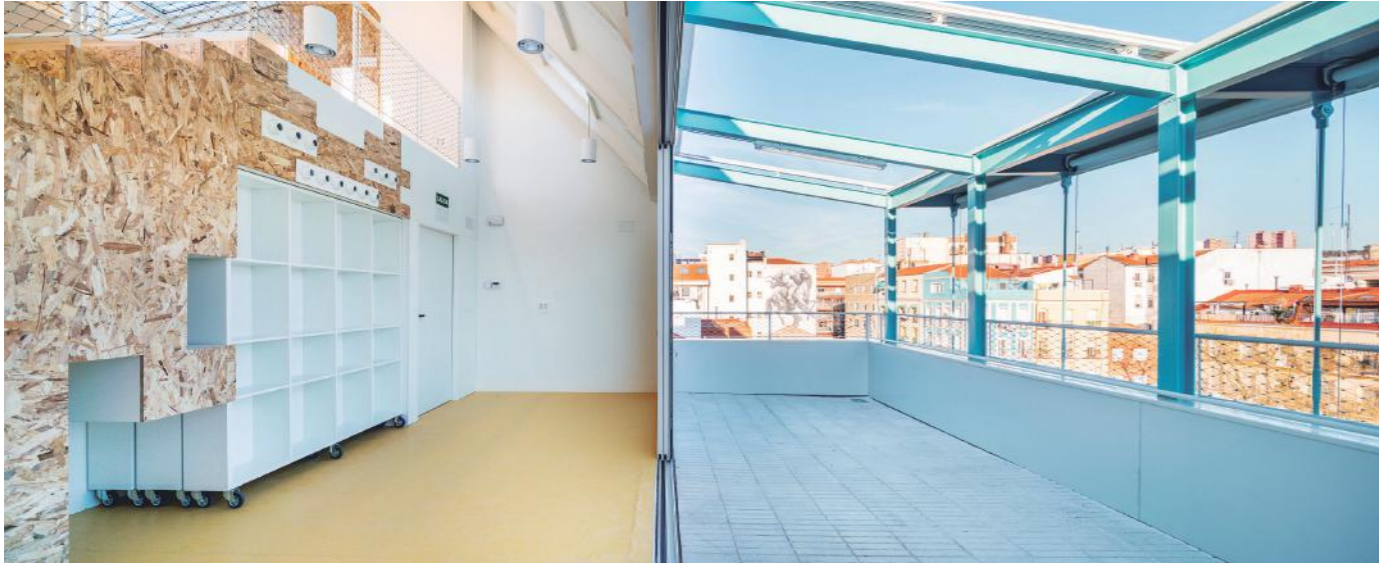
Foto: Save The Children. Centro de atención a la infancia. Rehabilitación de una edificación. Madrid-Imagen Subliminal

en el mundo profesional. Justo este año 2019, la Universidad Politécnica de Madrid nos ha premiado como el mejor grupo de innovación educativa de toda la universidad. Tratamos de transformar el aula en un despacho profesional, que como grupo, se debe enfrentar a cuestiones que se nos ponen delante cada día en el desarrollo de nuestro trabajo, para ir entrenando ciertas habilidades.