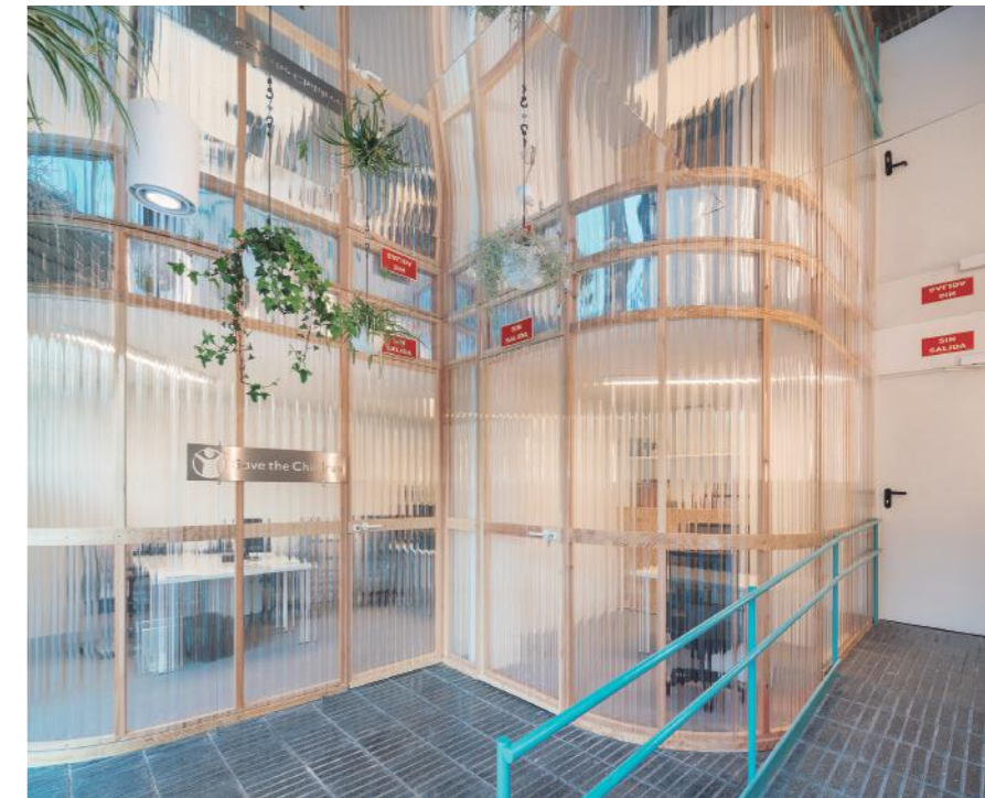
Centro de atención a la infancia. Rehabilitación de una edificación. (2016-2018)

Para mí es un drama nacional que, como país, hayamos invertido muchos recursos en formar a grandísimos profesionales y que sean otros países los que estén sacando rédito a todo ese conocimiento y saber hacer, porque no somos capaces de apostar por la investigación y la innovación dentro de nuestras fronteras. Una vez que el hecho de trabajar en el extranjero ya se ha producido por una cuestión u otra, nosotros siempre hemos aprendido mucho de trabajar y estar en contacto con otros contextos y formas de hacer, a la par que hemos compartido cómo desarrollamos nuestro trabajo y de