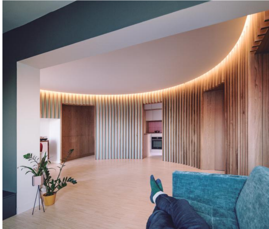
Reforma integral de una vivienda y un despacho profesional. Madrid. 2019

Primero que nada, defínanos qué es arquitectura tal y como se enseña en la universidad. Y, ¿qué es la arquitectura para usted como pasión, vivencia, como objeto de vida apartado de la simple definición?