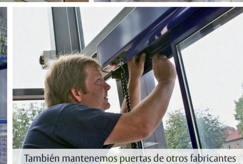
También mantenemos puertas de otros fabricantes

Puertas correderas • Puertas batientes • Puertas giratorias • Puertas industriales • Servicio