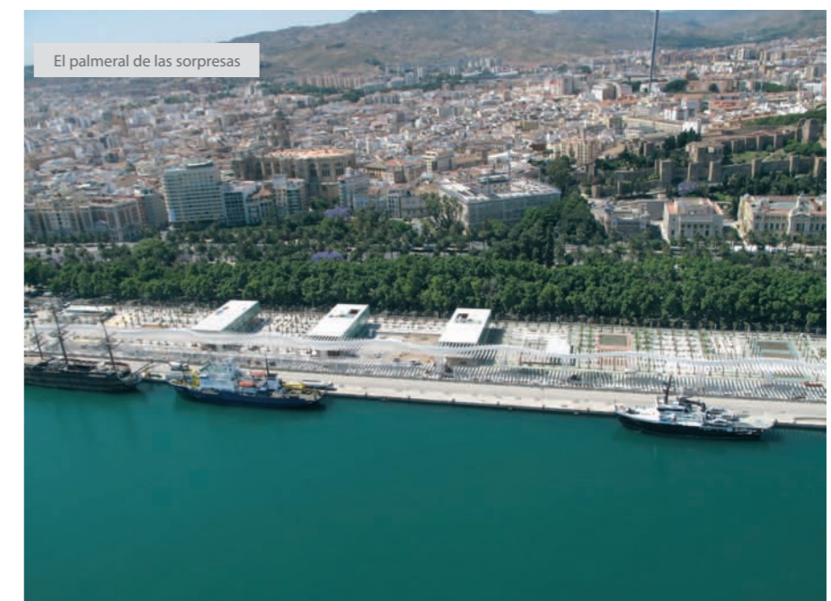
El palmeral de las sorpresas

No tengo predilección por ningún material, cada proyecto va encontrando su material y su sistema constructivo en el proceso