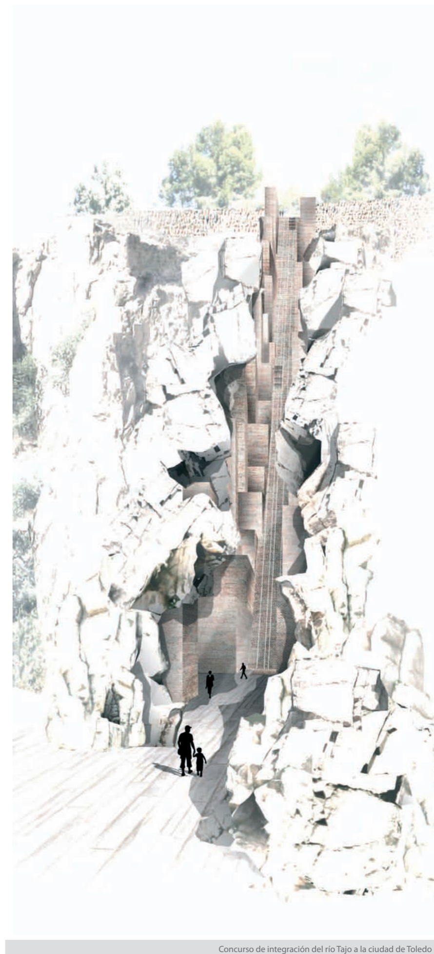
Concurso de Integración del río Tajo a la ciudad de Toledo

Como siempre haciendo concursos, la mayoría perdidos, pocos ganados. En concreto estamos con las obras de rehabilitación del Hipódromo de Madrid, terminando las obras de transformación de los muelles del Puerto de Málaga, la estación intermodal de Gijón y con unos proyectos parados por la actual crisis financiera en la que nos encontramos.