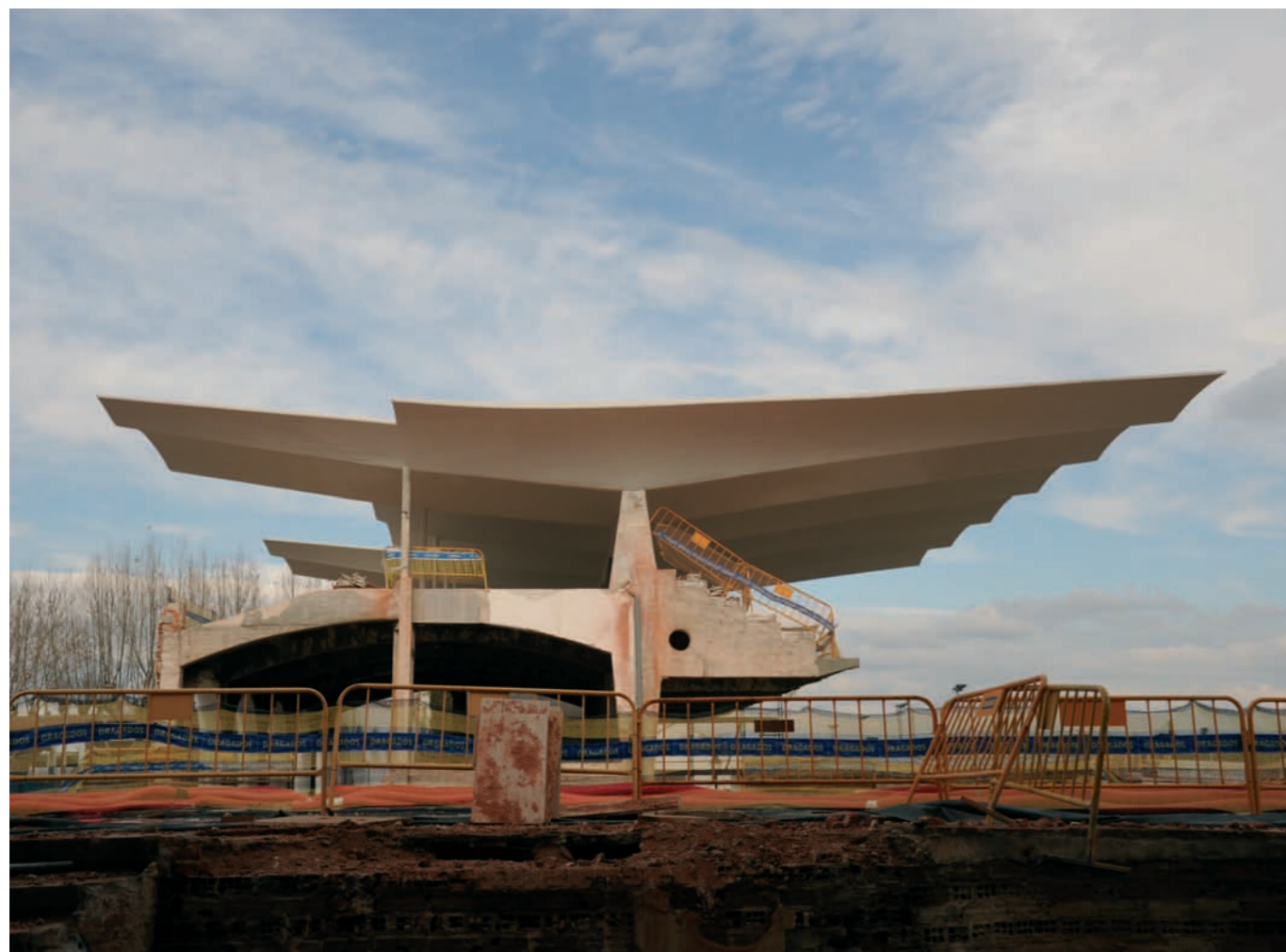
Rehabilitación y Restauración del Hipódromo de la Zarzuela, Madrid