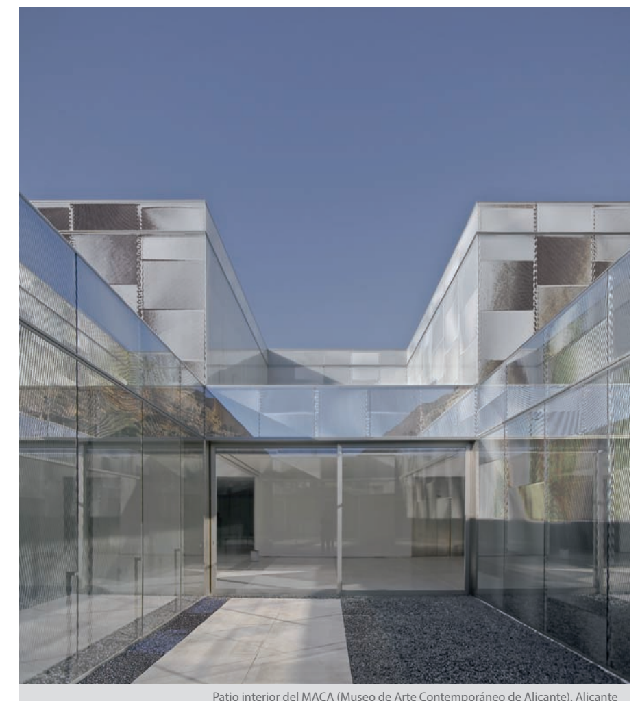
Patio interior del MACA (Museo de Arte Contemporáneo de Alicante). Alicante