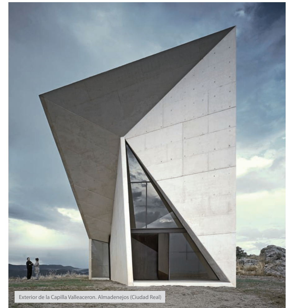
Exterior de la Capilla Valleacerón. Almadenejos (Ciudad Real)

En nuestro caso, nuestra especialidad es saber responder a cualquier tipo de programa y de situación. La especialización era un perfil de mercado tomado del modelo anglosajón de los 80.