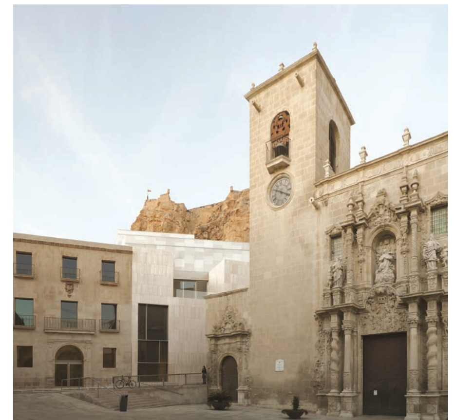
Exterior del MACA (Museo de Arte Contemporáneo de Alicante). Alicante