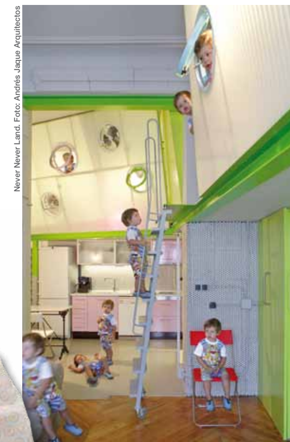
Never Never Land.

Llevando más lejos nuestras líneas de trabajo. En Corea del Sur vamos a ensayar un prototipo de equipamiento residencial público. Un fragmento de ciudad domesticada. Tenemos dos proyectos de espacio público en Madrid que nos ilusionan, un prototipo de vivienda apilable, un sistema de comunicación urbana.