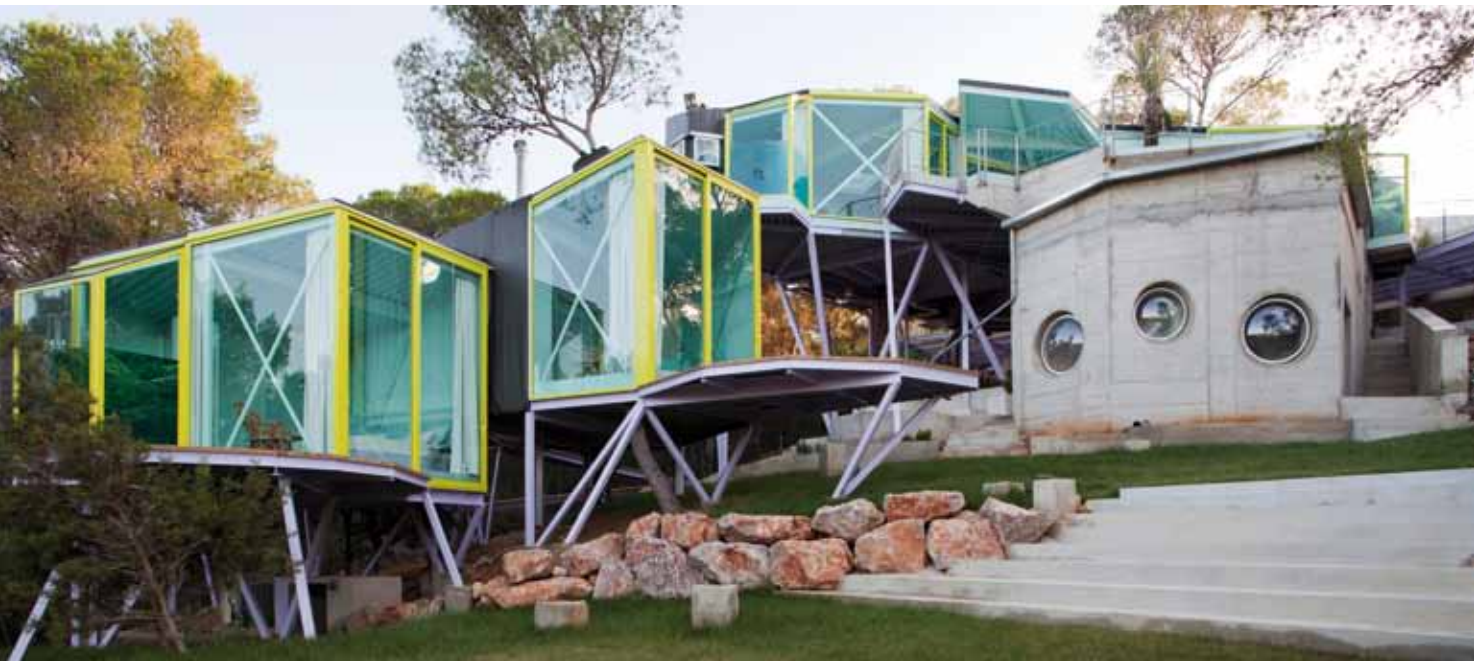
Never Never Land. Foto: Andrés Jaque Arquitectos

del enrolamiento público, son mucho más competitivos los mixes energéticos que incluyen sistemas de producción energética por medio de aerogeneradores.