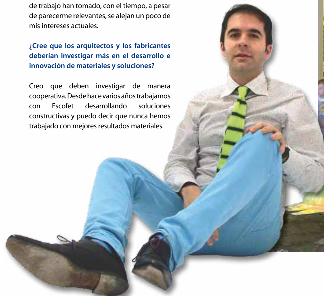
Indoor agora. Infografía: Andrés Jaque Arquitectos