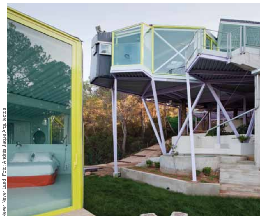
Never Never Land.

No hay espacios ideales, pero sí situaciones que pueden ser consideradas, desde diferentes puntos de vista, más competitivas que otras. Por ejemplo, los tejidos territoriales que surgen de la implantación de sistemas de producción y distribución de energía nuclear, tienden a la centralización y a la gran inmovilización de un territorio de grandes dimensiones, que pierde la posibilidad de poder ser reorganizado en un largo periodo de tiempo. Por otro lado tienden a excluir a sus usuarios finales de la capacidad para entender y evaluar su comportamiento. Esto hace que sean mucho menos transformables y que generen poca implicación de sus usuarios en su escrutinio. Por tanto, desde el punto de vista de la transformabilidad y