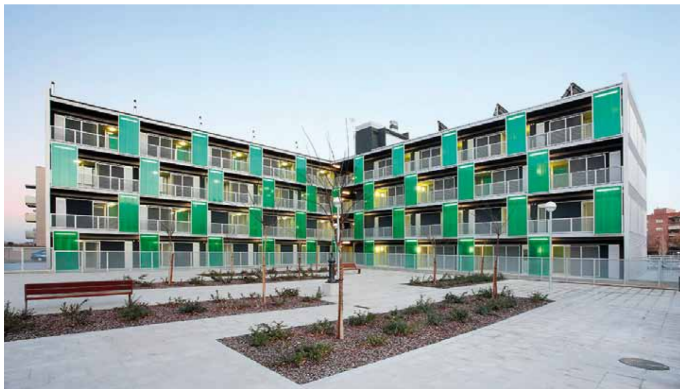
Viviendas VPO, Barrio de Pardiñes, Lleida

"Se están haciendo mal muchos planteamientos urbanos (de planificación) y como consecuencia las bases de los concursos"