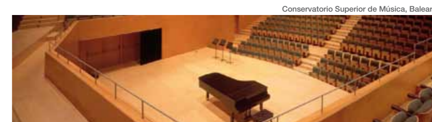
Conservatorio Superior de Música, Baleares

Se están haciendo mal muchos planteamientos urbanos (de planificación) y como consecuencia las bases de los concursos. Las decisiones no las toman los arquitectos (son políticas, económicas...) y cuando llegan las bases no