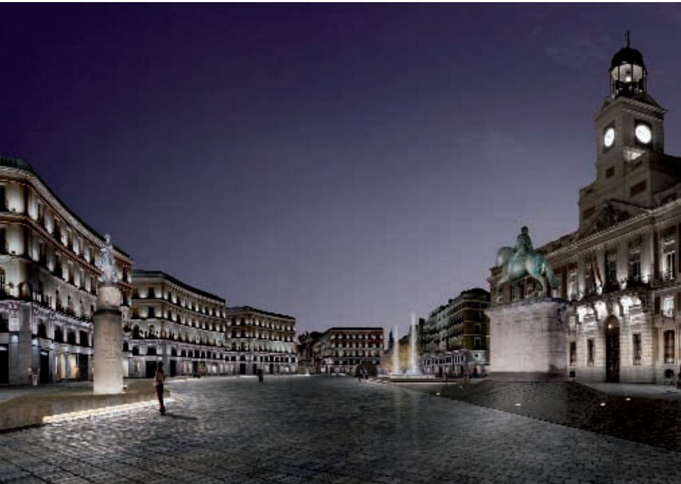
Infografía: Linazasoro & Sánchez Arquitectura

elementos que contribuyen a su degradación. Se proyectará un gran foro urbano, por esta razón es importante realizar un proyecto muy claro y esencial, sin concesiones al diseño mal entendido. Es por ello que se plantearán realizar las siguientes fases: