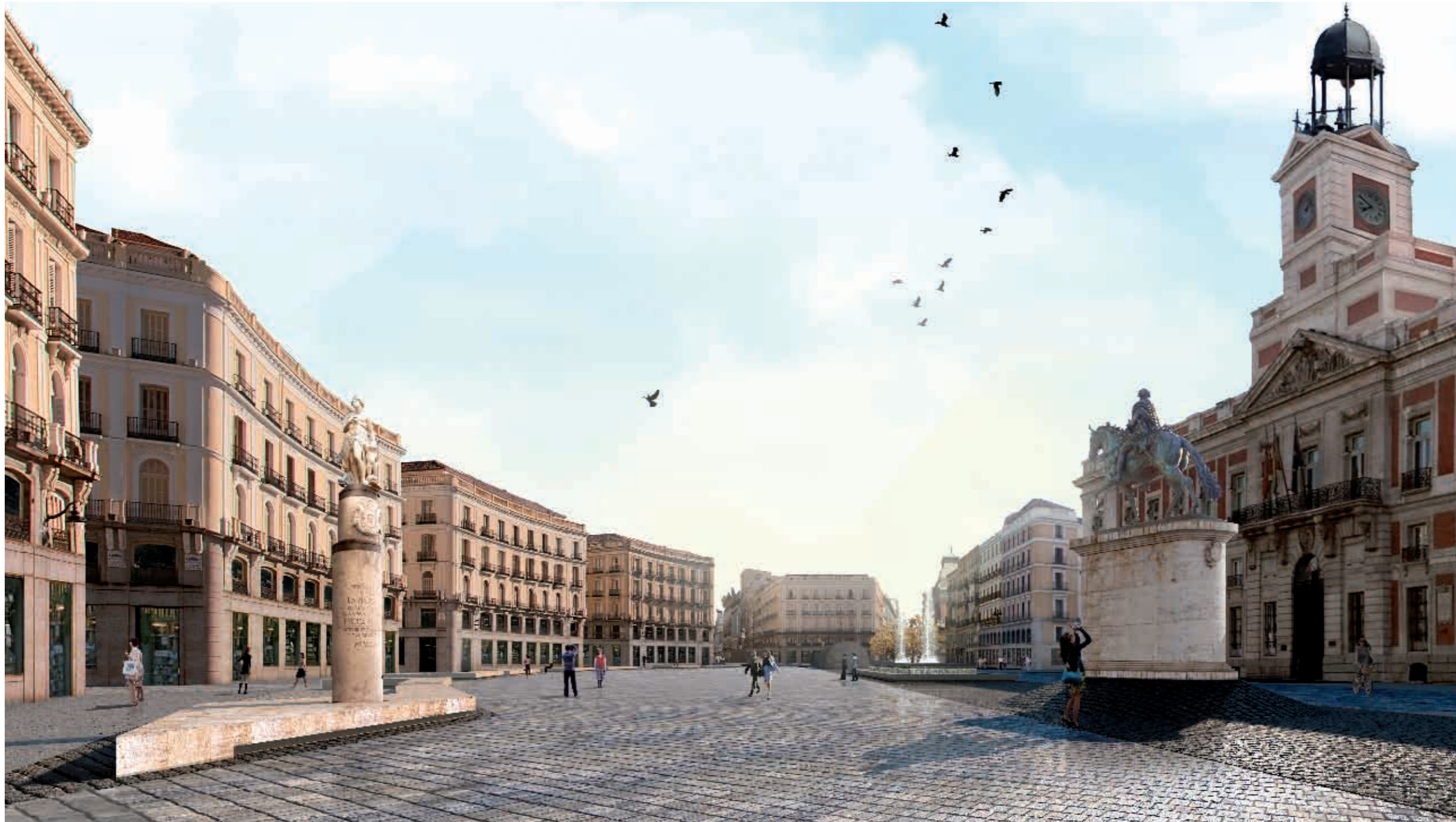
Infografía: Linazasoro &amp; Sánchez Arquitectura