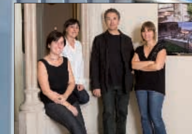
Equipo Santamaría Arquitectes

LA EFICIENCIA PARA UNA ARQUITECTURA POLIVALENTE