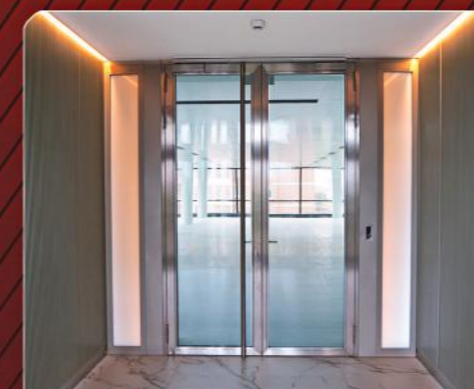
Puerta Cortafuegos Vidriada de Acero Inoxidable

"TORRESFIRE ha participado en este proyecto con toda su gama de PUERTAS CORTAFUEGOS, especialmente desarrolladas tanto por diseño, como por sistema de montaje, para proyectos de rehabilitación de edificios singulares"