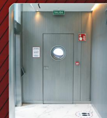
Puerta Cortafuegos Panelada