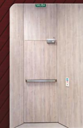
Puerta Batiente Cortafuegos Enrasada

"PUERTAS CORTAFUEGOS EXCLUSIVAS, PARA ENTORNOS ARQUITECTÓNICOS EXIGENTES"