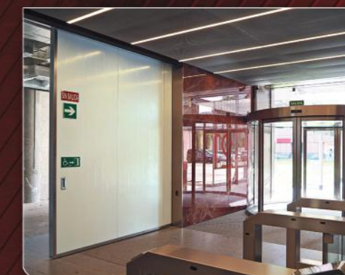
Puerta Corredera Cortafuegos