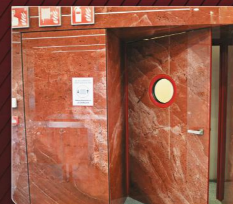
Puerta Cortafuegos SIN BISAGRAS Panelada Vidrio