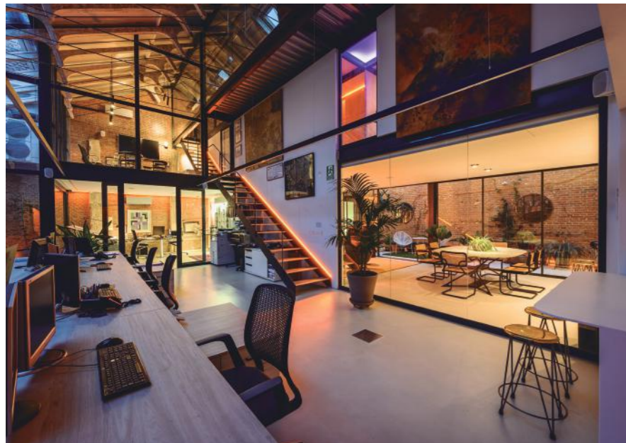
Foto: Casa-Estudio. C/Cuevas, 26. Madrid.

y Alma. Capacidad de Adaptación a las necesidades del cliente y a los condicionantes técnicos, económicos y legales del edificio en el que intervenimos. Alma que surge del respeto al entorno urbano y cultural, a la historia del edificio y los elementos dignos de ser conservados, también del entendimiento profundo de las necesidades del cliente con quien tratamos para, de una forma simbiótica, hacer crecer sus propias ideas.