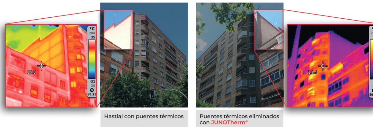
Hastial con puentes térmicos

Propuesta de una solución SATE personalizada en base al diagnóstico realizado.