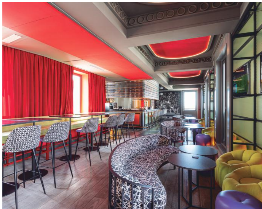
Foto: Hotel Pestana CR7 Gran Vía. C/Gran Vía, 29. Madrid. Octavian Craciun

durante décadas incluso siglos tuvo su propia y plena vida y que nosotros, como arquitectos e interioristas, debemos saber respetar en nuestra intervención.