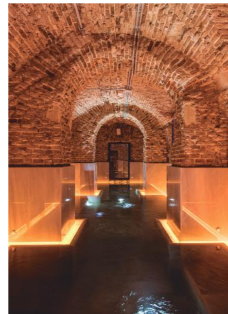
Foto: Hotel Pestana Plaza Mayor. C/ Imperial, 8. Madrid. Octavian Craciun

Me vas a permitir que use dos palabras en vez de una para definir nuestra arquitectura: Adaptación