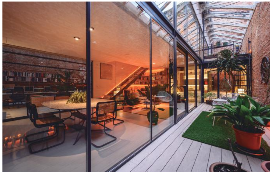
Foto: Casa-Estudio. C/Cuevas, 26. Madrid.

Por otro lado, la sostenibilidad no es solo un aspecto energético, tiene que ver también en cómo nuestra propuesta proyectual dialoga con el entorno tanto en aspectos estéticos, como culturales y de proximidad.