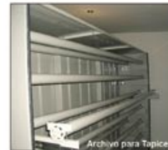
Archivo para Mapas