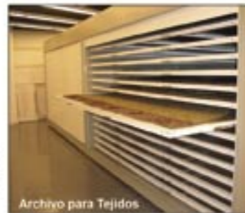
Archivo para Tejidos

RENTABILIDAD La posibilidad de dar la máxima capacidad de archivo en el mínimo espacio, rentabiliza los metros cuadrados destinados a archivo. CAPACIDAD Duplicación de la capacidad de archivo con respecto a las instalaciones de estantería convencional. ADAPTABILIDAD Los distintos diseños y el sistema modular, permiten una adaptación total al espacio disponible. Nuestro sistema consigue en cada caso optimizar la distribución de armarios. AGILIDAD Los armarios compactos de ARCHIMOVIL son perfectamente manejables gracias a un estudiado sistema de accionamiento guiado, ya sea por mecanismo manual, mecánico o eléctrico. SEGURIDAD Cada equipo va dotado de un sistema de cierre que lo convierte en un bloque hermético e inaccesible. EXPERIENCIA Y CALIDAD Numerosas instalaciones realizadas en centros de proceso de datos, bibliotecas, bancos, cajas de ahorros, hospitales, residencias sanitarias, compañías de seguros, centros oficiales, etc. avalan la calidad y el servicio de nuestro producto y nuestra firma. Aval que asimismo nos otorga el estar homologados por la Dirección General del Patrimonio del Estado, así como por la Consejería de Economía y Hacienda de la Junta de Andalucía, del Principado de Asturias y de la Generalitat de Catalunya. ARCHIMOVIL cuenta con el certificado de calidad según la Norma UNE-EN-ISO 9001:2000