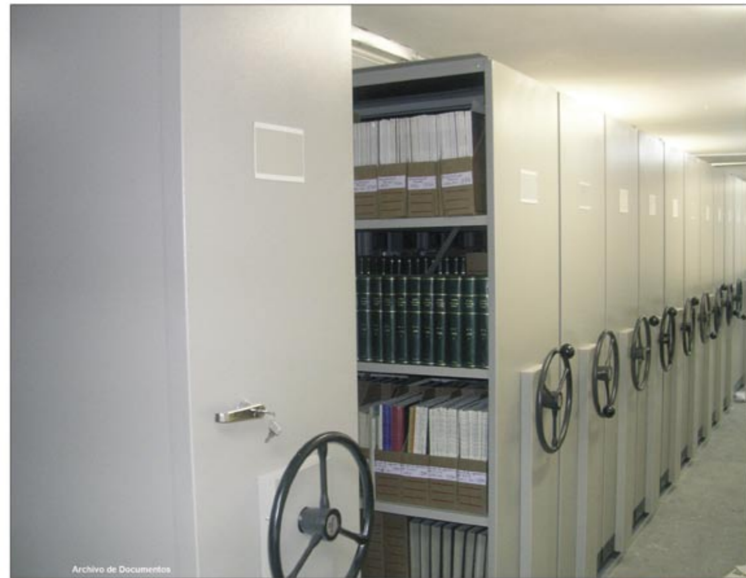
Archivo de Documentos