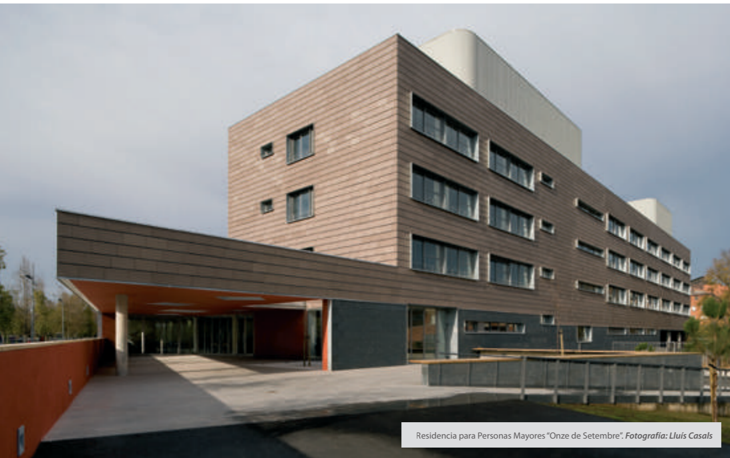
Residencia para Personas Mayores "Onze de Setembre".

Se pueden experimentar soluciones para viviendas unifamiliares que posteriormente sean aplicables a otras arquitecturas? ¿Es un campo tan distinto al resto como parece?