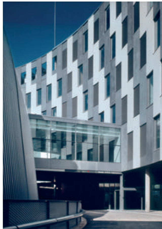
Edificio del Banco Sabadell en Sant Cugat del Vallès.