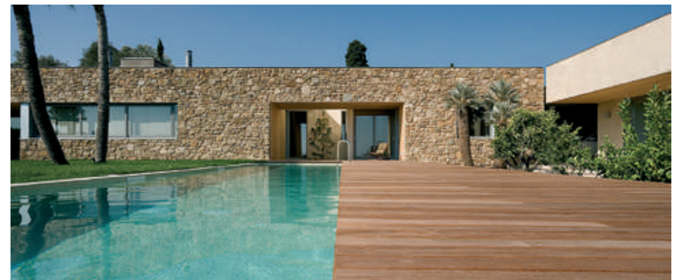
Casa y Estudio para un Pintor en Foixá.

cómo se deciden según qué aspectos o conformaciones, cómo se dibuja... todo es nuevo para el joven estudiante. De aquellos años con Bohigas recuerdo especialmente la consideración de los aspectos culturales de la arquitectura, el conocimiento del pasado inmediato del Modernismo a la República, el realismo constructivo, la conexión con Italia y tantas y tantas cosas. Con Federico, tardes enteras en su despacho hablando de la posición de un pequeño "office" y de su conveniencia en el proyecto de una generosa vivienda unifamiliar, y en general esa manera de atender y razonar la funcionalidad y el uso de las cosas. Han sido indudablemente dos maestros para mí.