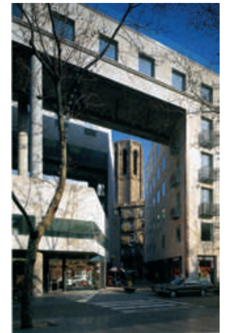
Palau Nou de La Rambla.

Se interesan igualmente por la técnica y por la estética. Sobre todo por la técnica que permite desarrollar formas caprichosas con apariencia de investigación estética. En cambio, se interesan poco —con valiosas excepciones— por el servicio a los reales problemas sociales.