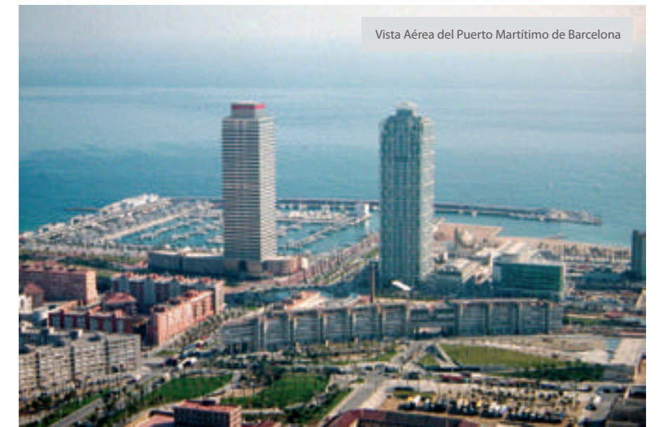
Vista Aérea del Puerto Marítimo de Barcelona

Casi siempre lo que se llama "planificación" funciona mal. En Italia y en España, desde que todas las ciudades tienen la obligación de aprobar un Plan general, todo el territorio se ha suburbializado. Lo que se necesita son proyectos urbanos puntuales, específicos, determinantes, sin ambigüedades cuantitativas y mal zonificadas.