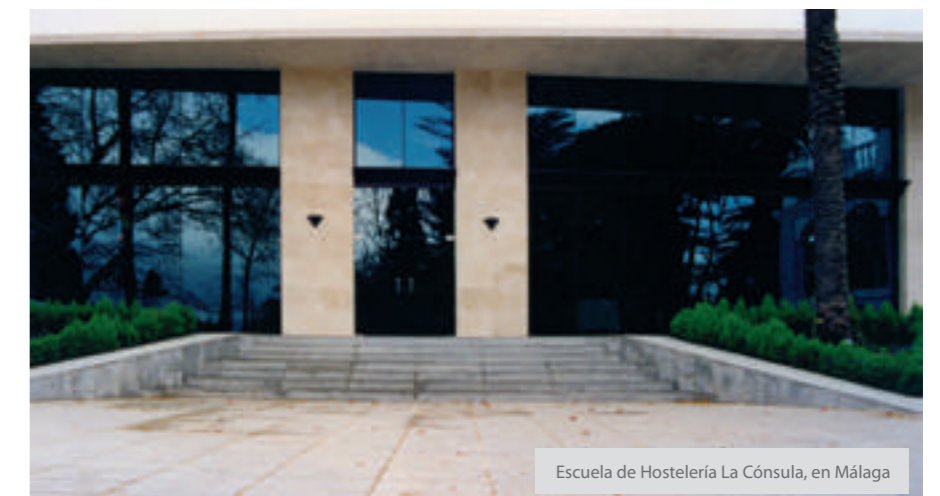
Escuela de Hostelería La Cónsula, en Málaga