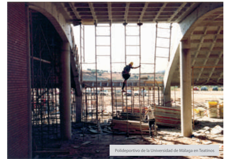
Polideportivo de la Universidad de Málaga en Teatinos

sido muy largo, también porque ha habido gran demora en la aparición de las normativas técnicas que han dado lugar al Código Técnico, a la LOE, etc. Estas normas salen en 2006, y desde entonces venimos hablando de celebrar una asamblea de debate, y si la hubiéramos realizado antes probablemente no tendríamos las claves de la legislación en ciernes, sino las claves parciales de lo que iba a venir en los terrenos de la regulación y las normas todavía desconocidos, y ahora estaríamos hablando del pasado y no de la actualidad. Ésa es la explicación más clara: el Congreso se ha hecho justo cuando está a punto de terminar el proceso de incertidumbre que han provocado todas estas legislaciones. Indudablemente deberemos celebrarlo más frecuentemente, pero esta vez el Congreso se planteó en 2007, la fecha se pospuso para dar un tiempo de preparación, y finalmente nos ha coincidido con la crisis. Sería razonable que en el plazo de 5 o 6 años se volviera a plantear una iniciativa parecida.