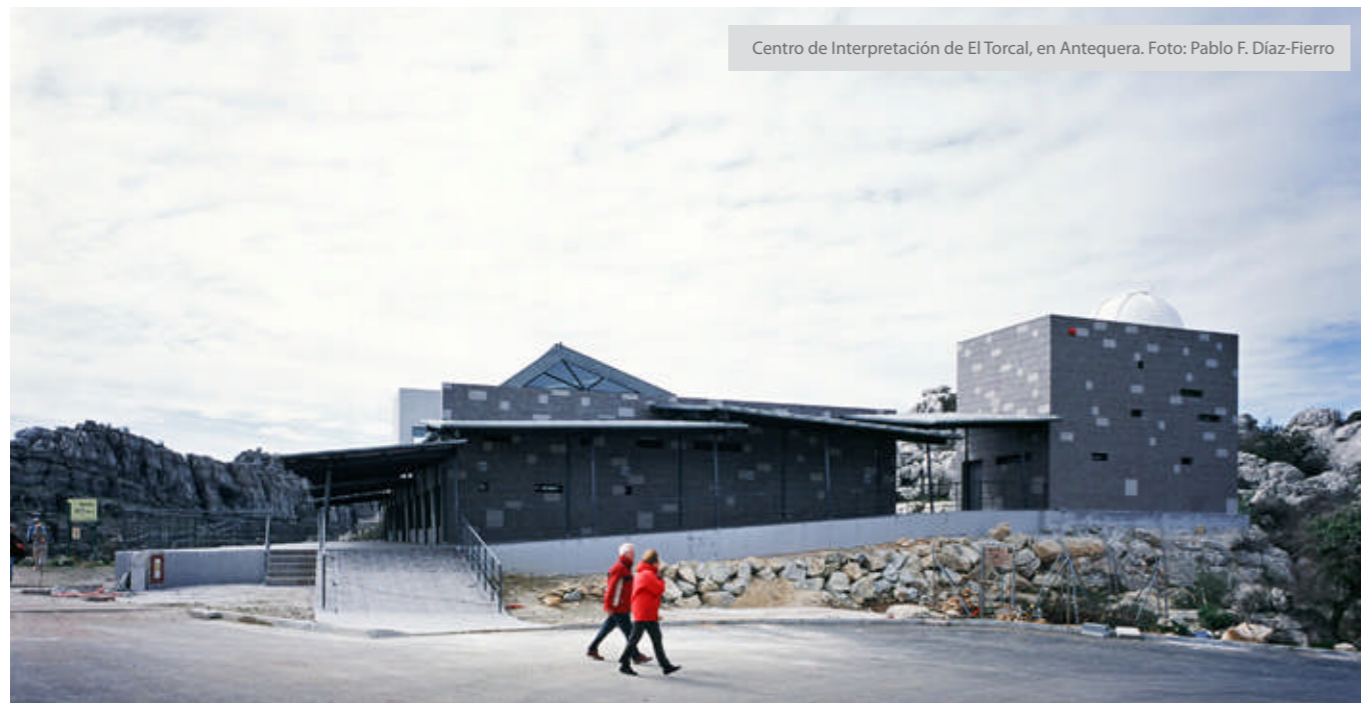
Centro de Interpretación de El Torcal, en Antequera.

principales en este ámbito. En cuanto a obra nueva, evidentemente ahora el campo de trabajo va a estar en las viviendas sociales y públicas más que en la vivienda libre, hasta que se compensen las tasas desequilibradas que han habido en estos últimos años.