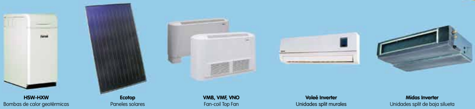
HSW-HXW Bombas de calor geotérmicas Ecotop Paneles solares VMB, VMF, VNO Fan-coil Top Fan Voleé Inverter Unidades split murales Midas Inverter Unidades split de baja silueta